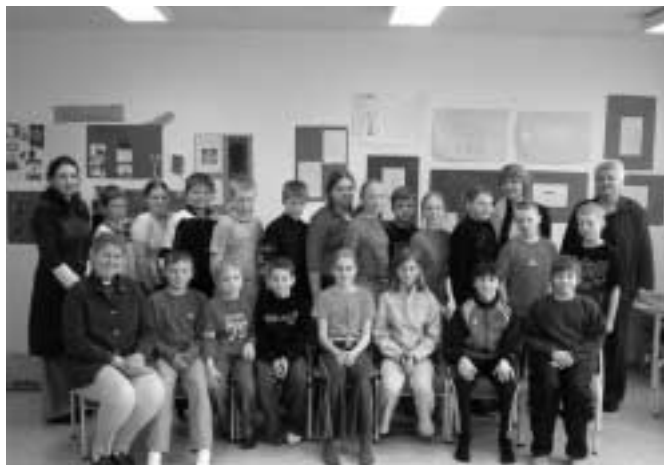
Ráðgjafarbekkur umboðsmanns í Varmárskóla, Mosfellsbæ.

Sem umboðsmanni barna er mér ætlað að stuðla að bættum hag barna, yngri en 18 ára og standa vörð um réttindi þeirra, hagsmuni og þarfir. Til að ég geti gegnt þessu hlutverki mínu þarf ég að þekkja þarfir umbjóðenda minna og vita um skoðanir þeirra á þeim málefnum, er þau varða. Í lok síðasta árs ákvað ég að leita nýrra leiða til að fá fram skoðanir og sjónarmið