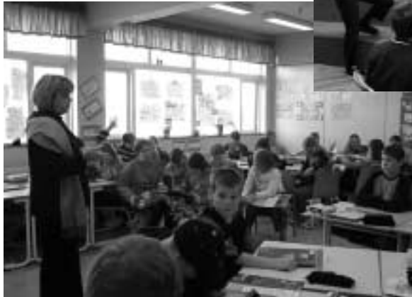
Umboðsmaður barna ræðir við ráðgjafana í Borgarnesi.

fræði í Menntaskólanum við Hamrahlíð, þar sem ég ræddi um embætti umboðsmanns barna, hlutverk þess og störf og svaraði að því loknu fjölmörgum spurningum nemenda, og hins vegar heimsókn í Réttarholtsskóla. Um var að ræða málþing, sem nemendur 10. bekkjar skólans stóðu fyrir um réttindi og skyldur unglinga og flutti ég þar stutt erindi, auk þess að sitja í pallborði.