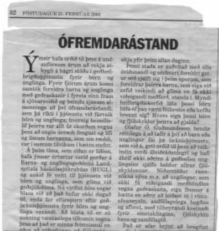
Úr leiðara Morgunblaðsins, 21. febrúar 2003.

framangreind mál, 16. október 2002. Fundur var haldinn í ráðuneytinu og þar voru m.a. framangreind mál rædd. Enn hefur fyrrnefnd greinargerð ekki borist embætti umboðsmanns barna. Samkvæmt upplýsingum úr fjölmiðlum hefur starfshópur nú verið skipaður til að skoða skipulag BUGL, en um stefnumörkun og framkvæmdaáætlun hefur lítið verið fjallað.