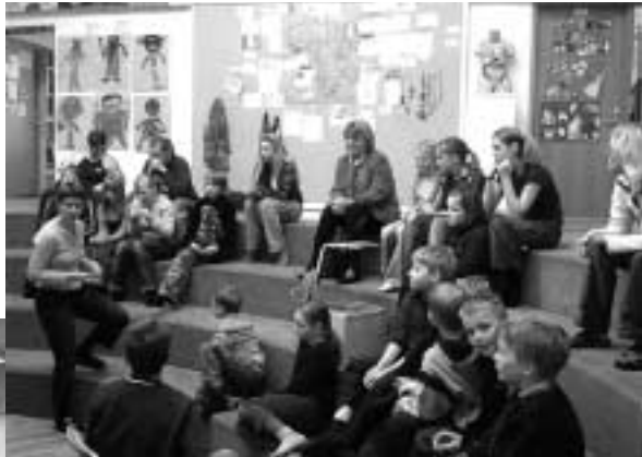
Umboðsmaður með ráðgjöfum sínum í Þykkvabæ.

nokkrum dögum síðar, en þeir voru Fellaskóli, Mýrarhúsaskóli, Smáraskóli og Varmárskóli. Í heimsóknnum mínum ræddi ég við ráðgjafana og hlustaði eftir skoðunum þeirra, sem þeir voru viljugir að gefa upp.