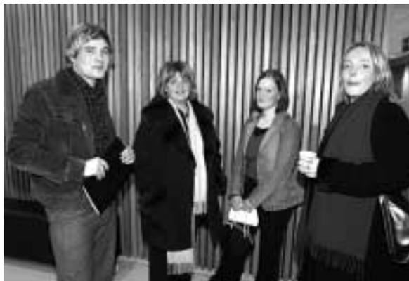
Á málþingi menntamálaráðuneytisins um samræmd próf við lok grunnskóla.

Í tilefni af málþingi menntamálaráðuneytisins um samræmd próf við lok grunnskóla, sem haldið var 21. nóvember 2003, var ég beðin um að benda á tvö ung-