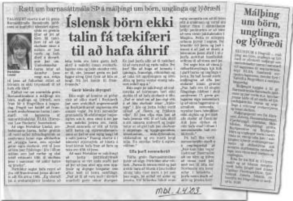
Morgunblaðið, 1. apríl 2003