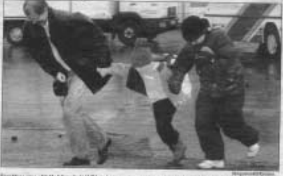
Foreldrar eiga að taka tillit til lífi og heilbrigðis barna og tryggja barna til að rjúta fríðhelgi einkalífs.