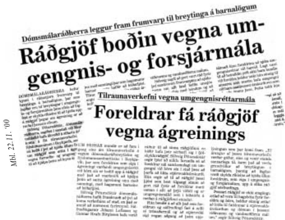
Mbl. 22.11. '00