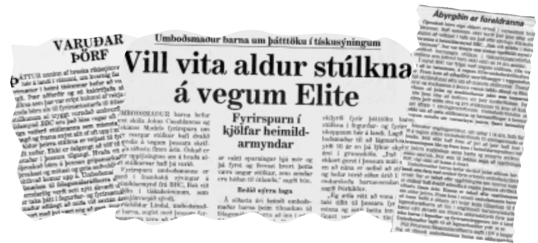
Úr leiðara Mbl. 14.12. '99

Á síðasta ári beindi umboðsmaður barna þeim tilmælum til félagsmálaráðherra að inni núgildandi barnaverndarlög kæmi nýtt ákvæði um tiltekin aldurskilyrði fyrir þátttöku barna/stúlkna í fegurðar- og fyrirsætukeppnum hér á landi. Umboðsmaður lagði til að lágmarksaldur yrði 16 ár, en við þau tímamót lýkur skyldunámi í grunnskóla, og í kjölfar þess er að jafnaði tekin ákvörðun um nánustu framtíðaráform einstaklingsins.