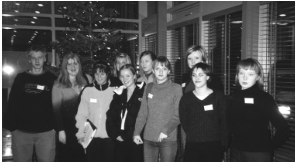
Þátttakendur í málþingi um skólareglur og aga.